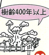
樹齢400年以上 謙信手植えの松